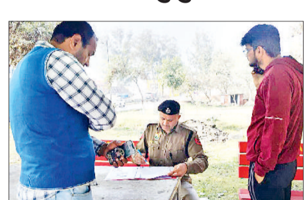
झज्जर। अस्पताल परिसर में पोस्टमार्टम के लिए कागजी कार्रवाई करते हुए पुलिसकर्मी।