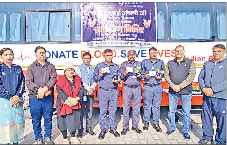
झज्जर। शिविर के दौरान उपस्थित रक्तदाता एवं रिलायंस प्रतिनिधि।