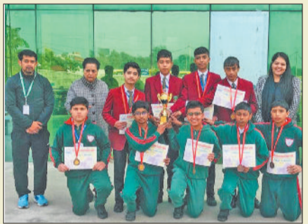
बहादुरगढ़। विजेता खिलाड़ियों के साथ स्कूल प्रबंधन।