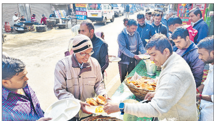
बहादुरगढ़। नाहरा-नाहरी रोड पर भंडारे में प्रसाद वितरित करते दुकानदार।

बता दें कि हरियाणा-दिल्ली समेत कई राज्यों में बाबा हरिदास की मान्यता है। गांव झाड़ौदा में बाबा हरिदास का विशाल मेला साल में दो बार चैत्र व अश्विन शुक्ल की छठ पर लगता है। जबकि मासिक मेला प्रत्येक