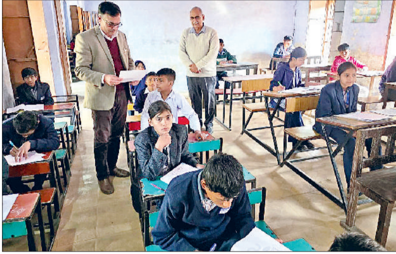
झज्जर। परीक्षा केंद्र का निरीक्षण करते हुए पर्यवेक्षक टीम सदस्य।