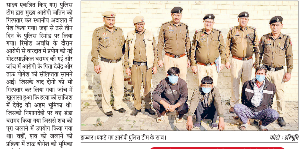
झज्जर। पकड़े गए आरोपी पुलिस टीम के साथ।