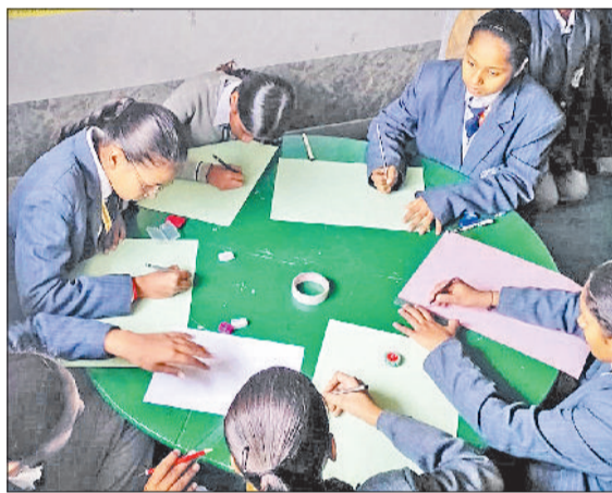
बहादुरगढ़। कार्यक्रम में चित्रकला करते बाल विकास स्कूल के विद्यार्थी।