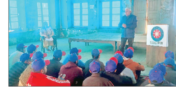
झज्जर। स्वयंसेवकों को साइबर सुरक्षा की जानकारी देते हुए शिक्षक।