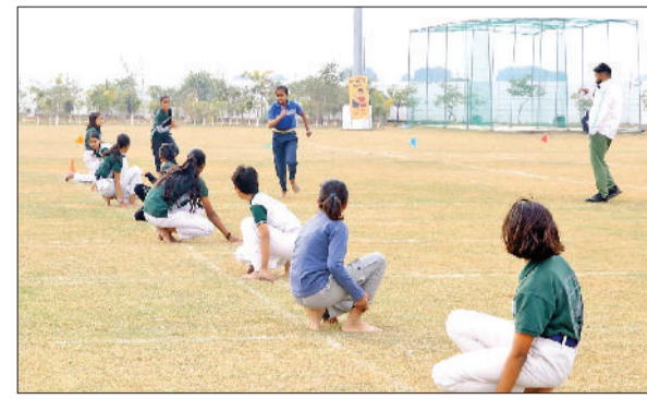
झज्जर। खो-खो प्रतियोगिता में भाग लेते हुए प्रतिभागी।