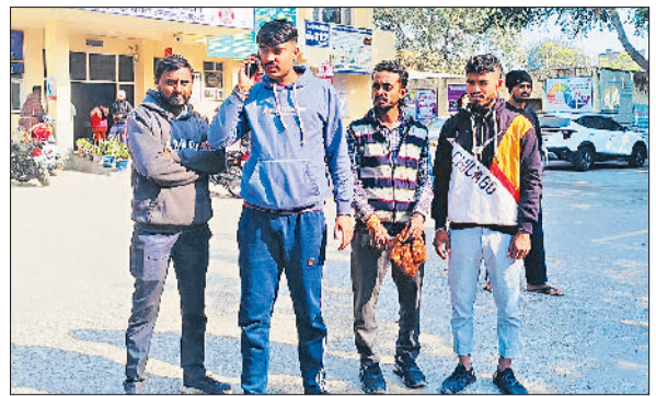
बहादुरगढ़। अस्पताल में मौजूद मृतक के परिजन।