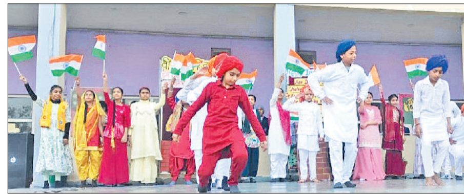
बहादुरगढ़। कार्यक्रम में प्रस्तुति देते फाउंडेशन स्कूल के विद्यार्थी।