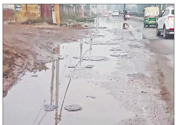
बहादुरगढ़। झज्जर रोड पर जलभराव के कारण हालत।

झज्जर से बहादुरगढ़ आते वक्त यहाँ फ्लाईओवर के पास काफी दूर तक सड़क पर पानी भरा रहता है। दरअसल, यहां जल निकासी की व्यवस्था ठप है। इसलिए आधी सड़क तक पानी जमा रहता है। जलभराव के कारण मार्ग क्षतिग्रस्त हो गया है। चौपटिया वाहन चालक तो जैसे जैसे निकल जाते हैं लेकिन दोपटिया वाहन चालकों को मुश्किलों का सामना करना पड़ रहा है। धुंध और अंधेरे में यहां हादसे का खतरा बढ़ जाता है। इस तर्फ ध्यान